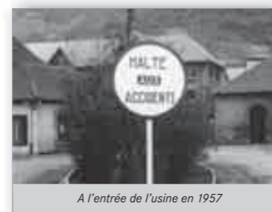
A l'entrée de l'usine en 1957

" La pérennité du site thannois et les progrès réalisés au fil des années prouvent que cette conscience industrielle a toujours été présente dans la gestion des activités industrielles et pris aujourd'hui une place prépondérante. "