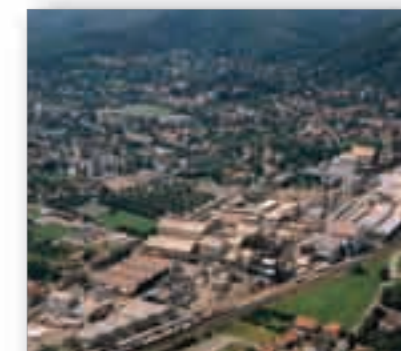
Le Site industriel de Thann