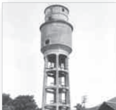
Le château d'eau de l'usine percé par un obus en 1915

Le sort de l'usine de Thann a souvent été influencé par des facteurs géopolitiques extérieurs.